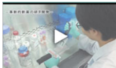
大日本住友製薬のルーツ